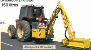
détail pivot à 90° (option)