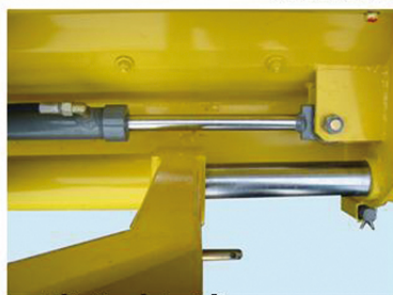
détail vérin télescopage