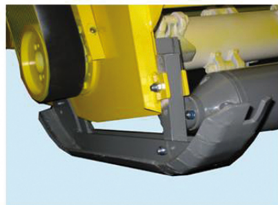
Option rouleau + skis